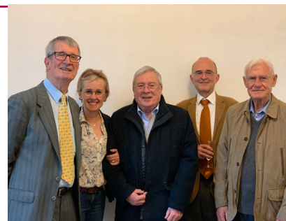
les présidents de SLMM depuis 2004